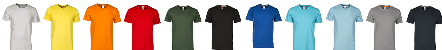
BLANC JAUNE ORANGE ROUGE VERT NOIR BLEU ROI BLEU ATOLL AZUR GRIS ACIER BLEU MARINE